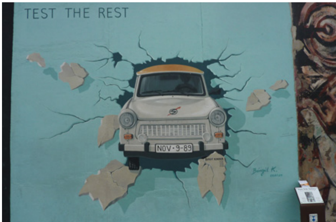
MURALES Uno dei danti dipinti su quel che resta del Muro all'Est Side Gallery

Chi cerca cose meno convenzionali, può fermarsi nelle boutique degli Hackesche Höfe o al mercato delle pulci della Straße des 17 Juni per acquisti originali e a buon mercato. L'aeroporto di Tegel è raggiungibile da Malpensa con Air Berlin (www.airberlin.com) che propone tariffe volo&hotel da 226 euro per 3 notti in hotel 4 stelle, a persona, fino a fine ottobre. Easyjet (www.easyjet.com) dispone di voli diretti Malpensa-Berlino: da 23,99 a tratta, tasse incluse, e Pisa-Berlino da 25,99 euro a tratta, tasse incluse. Ryanair (www.ryanair.com) garantisce voli giornalieri da Orio al Serio a Berlino Schönefeld a un costo a/r di 97 euro tutto incluso. Se cercate un hotel consultate booking.com e hostelworld.com oltre a navigare su www.visita-berlino.it, www.berlin-welcomecard.de e www.germany.travel, dove trovare mille informazioni utili. Concedetevi una prima colazione tradizionale in un locale della vecchia città come il Café Einstein (www.cafeeinstein.com) sulla Kurfürstendamm. Sazi fino a sera con meno di 10 euro.